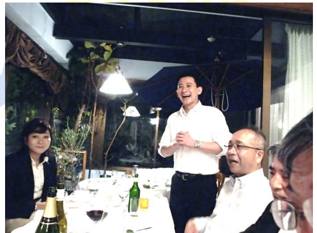
アルコールが入ると勉強になるかな？