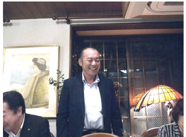
坂下会員の歓迎会ですよ