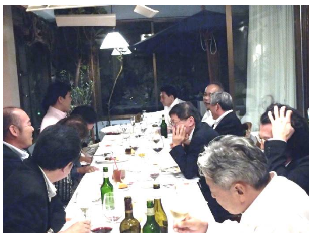
次の料理まで暇そうです