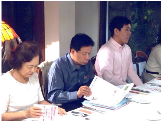
勉強しているようです