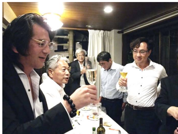
締めはだれがやりましたっけ??