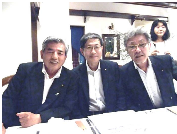
平均年齢は十分年金受給者