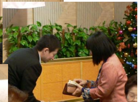
たくさん入ってますネ!