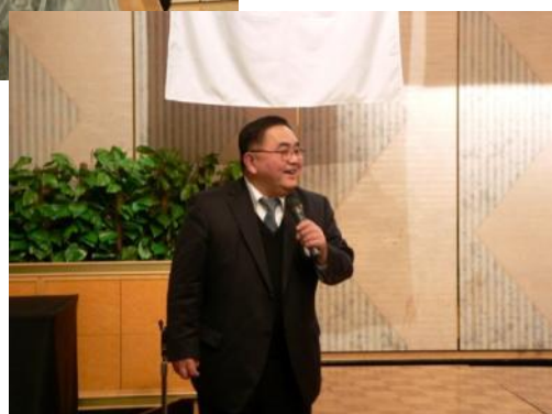
最後は高山ガバナー補佐の締め