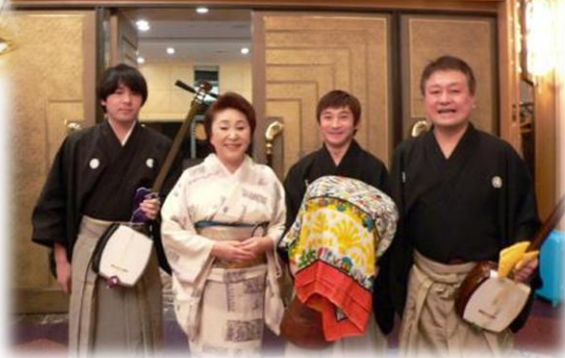
熱演お疲れ様でした