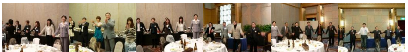
恒例の手に手つないで 手がつながっているかな?